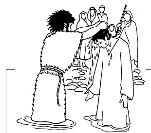
«Giovanni proclamava un battesimo di conversione...»

Anno 2020 - N. 46 - Domenica 6 Dicembre - Seconda d'Avvento