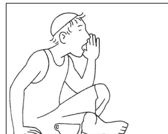
«Figlio di Davide, Gesù, abbi pietà di me!»

Anno 2015 - N. 39 - Domenica 25 Ottobre - XXX del Tempo Ordinario